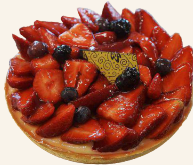
Le Biscuit aux Fraises

4 pers. - 11,90€ 6 pers. - 15,90€ 8 pers. - 19,90€