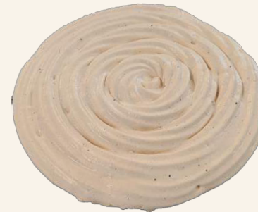
Le Disque de Meringue