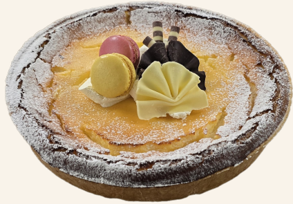
La Tarte au Fromage Blanc