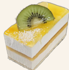
Le délice des Îles