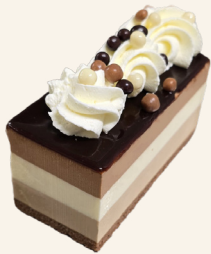
Le 3 Chococats