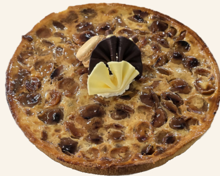
La Tarte aux Mirabelles