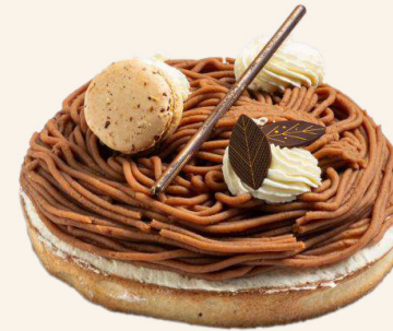
La Tarte Torche aux Marrons