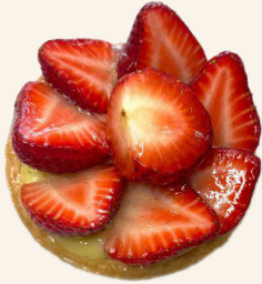
La Tartelette aux Fraises