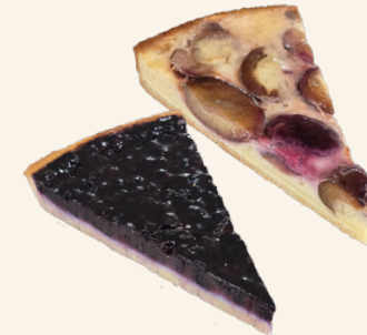
Quetsches ou Myrtilles