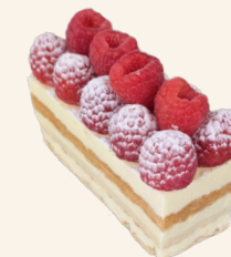
Mille-Feuille Framboises, Fraises ou Fruits