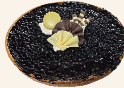
La Tarte aux Myrtilles